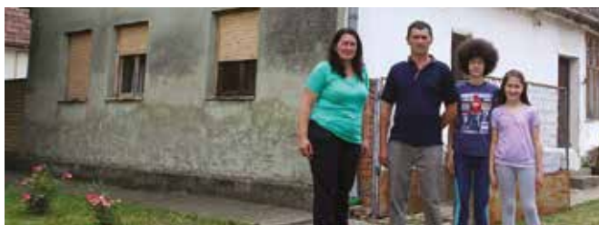
Porodica korisnika u Srbiji

Vrijednost ovog potprojekta je EUR 2,2 miliona, a obuhvata 66 montažnih kuća i 129 paketa građevinskog materijala. Prvih 25 paketa, podijeljenih u oktobru prošle godine, finansirani su doprinosom države za Projekt stambenog zbrinjavanja Srbije.