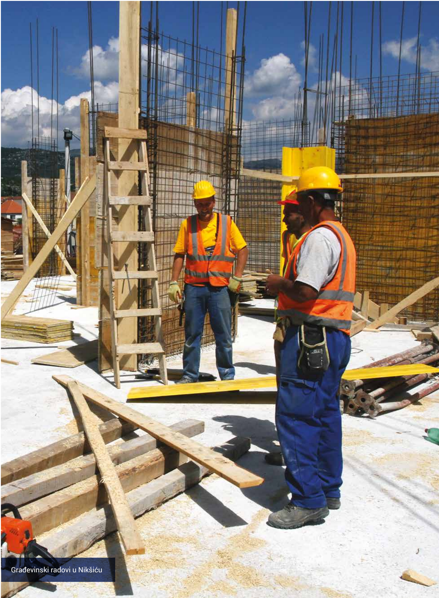
Građevinski radovi u Nikšiću