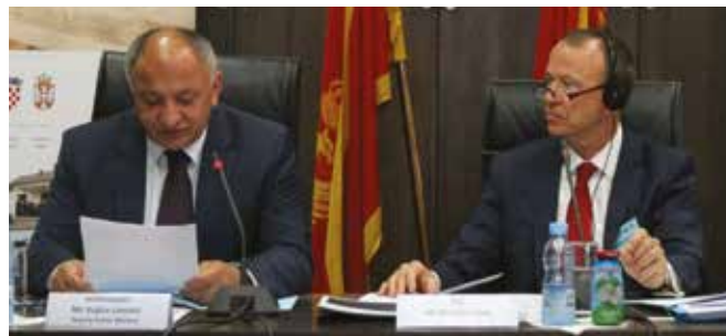
Vujica Lazović, zamjenik premijera Crne Gore, i Morten Jung iz Evropske komisije

Učesnici sastanka također su imali priliku vidjeti i regionalni RSP-film i izložbu fotografija gradilišta RSP-a i porodica korisnika, gdje su predstavljeni dosad najvažniji rezultati Programa na terenu.